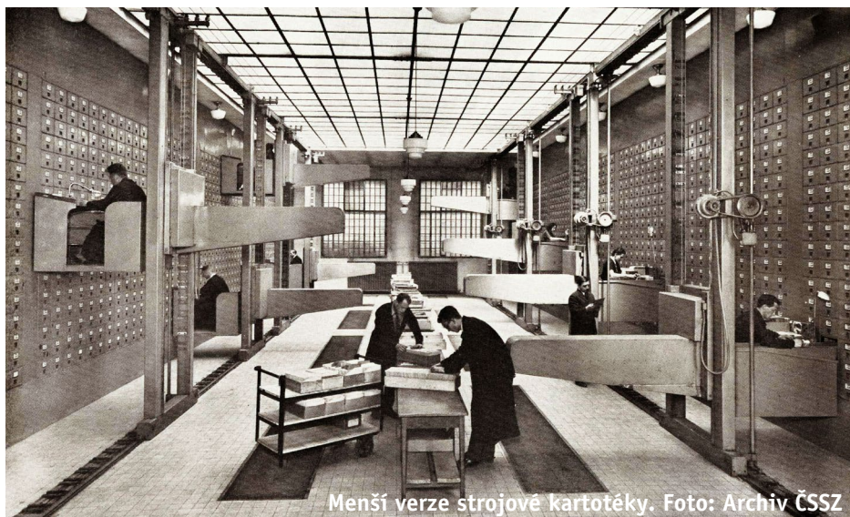
Menší verze strojové kartotéky.

ČSSZ soustavně usiluje o to být moderní, efektivně fungující, stabilní a důvěryhodnou institucí, která